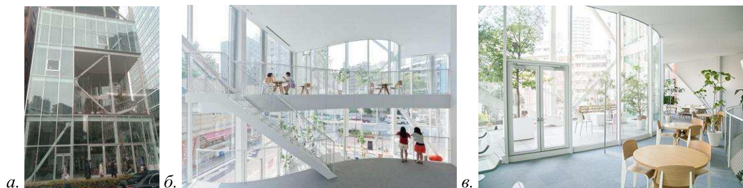
Рис. 2. Офис в центре Токио: а) вид с улицы (фото автора); б, в) внутреннее пространство; ( https://www.domusweb.it/en/architecture/2011/12/14/tokyo-s-vertical-thresholds-1-kazuyo-sejima.html )

3.2. Сохраняя естественный ландшафт. ART Site Naoshima. Целый остров-музей под открытым небом, расположенный на острове Наосима, Сикоку. Остров разбит на несколько зон, каждая из которых несет в себе свою историю и некоторую идею. Он живет своей жизнью, несмотря на большой поток приезжих. На улицах города нет табличек или указателей для туристов. Множество архитекторов, дизайнеров и художников добивались того, чтобы зритель стал частью острова. Рассмотрим некоторые постройки, ставшие культовыми на этом острове.