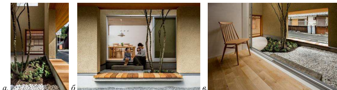
Рис. 1. Проект частного дома в г. Кога: а) вид со входа; б) вид с улицы; в) интерьер; ( https://www.dezeen.com/2017/09/25/kyomachi-house-hearth-architects-roofed-garden-tree-japanese-residence/ )

3.1. Как часть здания. Рассмотрим проект частного дома Киёмачи в городе Кога, на юге префектуры Сига; бюро Hearth Architects (рис. 1). Данный объект расположен в старинном квартале, на пересечении двух основных дорог. Место очень солнечное, поэтому архитекторы приняли решение сделать внутренний сад с одним деревом, где жители зимой смогли бы наслаждаться солнечным светом, пробивающимся через ветки дерева, а летом использовать как солнцезащитное средство. Благодаря задумке архитекторов, из любой точки дома можно созерцать пространство сада. Житель дома становится собеседником природы. Клиенты наслаждаются сменой сезонов через символическое дерево [6].