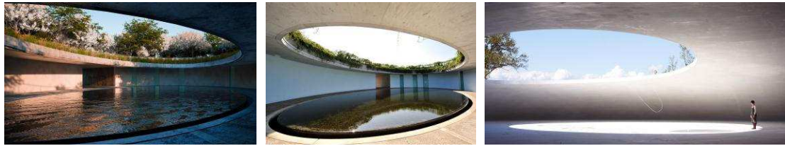
Рис. 4. Teshima Art Museum (benesse-artsite.jp)

В качестве примера можно привести ещё один знаменитый Арт-объект на острове Наосима.