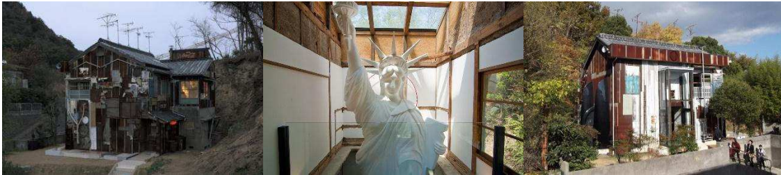
Рис. 5. Art House Project Naisha ( https://en.japantravel.com/kagawa/naoshima-art-house-project/3415 ; https://supertouriste.com/japon-naoshima ; http://theglobaljournal.net/group/illustrated-books/photo/68/ )

Art House Project Naisha – один из домов арт-пространства острова (рис. 5). Статуя Свободы пронзает здание изнутри, возвышаясь на два этажа. Яркий пример использования объектов открытого пространства, находящегося внутри здания. Авторы взяли узнаваемые объекты – образы традиционного японского дома и Статуи Свободы и интегрировали (человек подсознательно считает данное пространство замкнутым и маленьким).