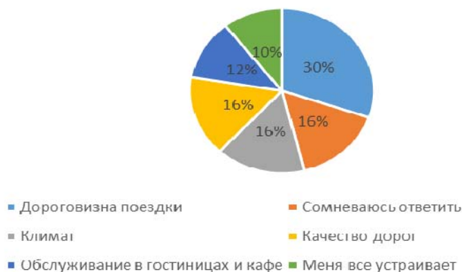
Рис.4 Что вас больше всего пугает при путешествии в Хабаровский край?

Результаты анкеты ещё раз подтвердили, что Хабаровский край является привлекательной туристской дестинацией, но многие не хотят посетить его по многим причинам, из которых лидирует дороговизна поездки (Рис. 4).