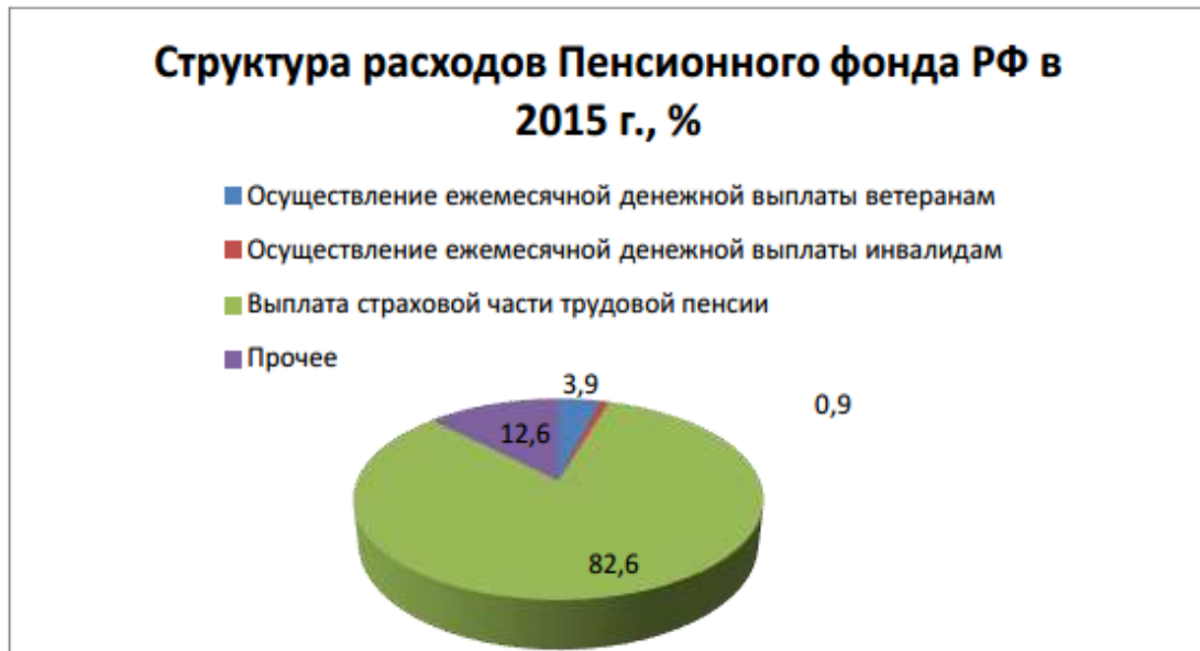
Рис. 1. Структура расходов Пенсионного фонда РФ в 2015 г., %

На рисунке 2 представлена структура доходов бюджета за 2015 год.