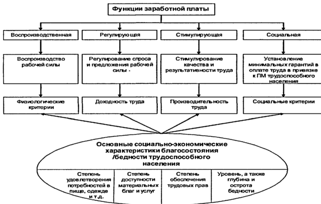
Рис. 2 Взаимосвязь заработной платы и бедности трудоспособного населения

С точки зрения занятости, определения «новой» бедности может трактоваться, как невозможность в силу неравного доступа на рынке труда к продуктивной занятости заполучить работу с достойным уровнем заработной платы, который обеспечивает прожиточный минимум работника.[2] Так, или иначе, взаимосвязь рынка труда и бедности