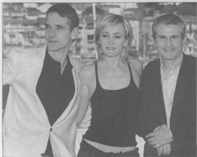
Джереми Айронс, Патрисия Каас и Клод Лелуш на Каннском кинофестивале