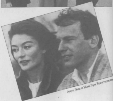
Анук Эме и Жан Луи Трентиньян