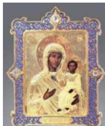
Рисунок 3. Фабрика Сазикова «Оклад для иконы»

Только в семидесятых и восьмидесятых годах 20-го века начинается новая волна интереса советских художников к богатым возможностям художественной эмали. Советские эмальеры получают возможность принимать участие в международных творческих семинарах сначала в Венгрии и Прибалтике, а затем и в других странах Западной Европы [5].