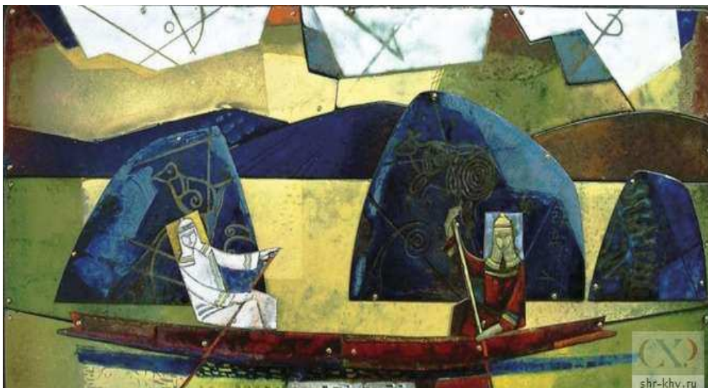
Рисунок.5 Конченков А.А. «Амур - река легенд». 2009 Медь, эмаль. 30 x 60

В настоящее время, в технике горячей эмали работают и молодые художники, выпускники Дальневосточной академии искусств (Рис.6)