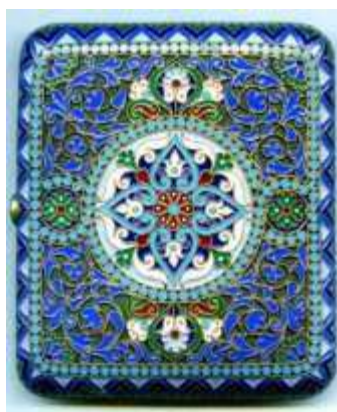
Рисунок 2. Овчинников «Царский Портсигар»