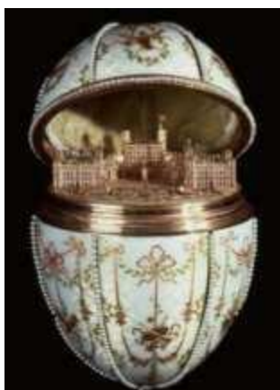
Рисунок 1. «Гатчинский дворец» Фаберже

пришла цветочная роспись на белом или цветном фоне, близкая к росписи по фарфору, а также советская символика и миниатюрная живопись на эмали в духе соцреализма. Позднее на базе ростовских артелей была организована фабрика «Ростовская финифть» [2],