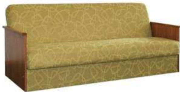
Рисунок 4. Диван-кровать[2]

В конце XIX века трансформирующаяся мебель стала привычным явлением в квартирах горожан. В Германии были изобретены кровати с выдвигаемыми ящиками для хранения белья, а в Англии переняли традиции изготовления походной мебели и создали комоды, которые в домашних условиях использовались как традиционный предмет мебели, а в путешествиях – как складные чемоданы. Самой популярной разновидностью трансформирующейся мебели стал диван-кровать (рис. 4) [3, с.88].