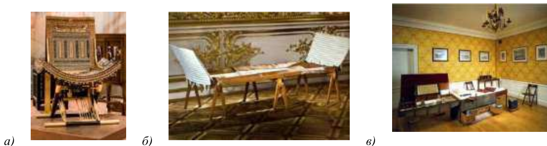
Рисунок 1. а) Складной стул-трон фараона Тутанхамона; б) Кровать-раскладушка Александра I для военных походов; в) Складной кабинет Александра III для военных походов[2]

крышки, которые легко преобразовывают его в умывальный столик с зеркалом, здесь же предусмотрено место для хранения предметов личной гигиены – графины для воды, металлический тазик, маникюрный набор. В других отделениях нашлось место головным уборам, эполетам, коробочкам для хранения табака и дорожному несессеру. Отдельное место отведено под гомеопатическую аптеку. В верхнем отделении сундука имеется отсек для походной мебели – компактный письменный стол с конторкой и два складных кресла. Еще одна особенность сундука заключалась в трансформации верхнего отделения после освобождения его от мебели в походную кровать [2, с.56].