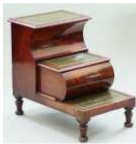
Рисунок 2. Трансформирующаяся лестница-комод английского производства[2]

Аристократы Франции и Англии тоже пользовались трансформирующейся мебелью. Почти каждый из них имел в своем кабинете и библиотеке складные секретеры и кресла-кровати. Одним из самых практичных и удобных изобретений можно считать лесенки-комоды или лесенки-диваны, которые имели классические свойства трансформирующейся мебели: компактность и многофункциональность (рис. 2)[2, с.72].