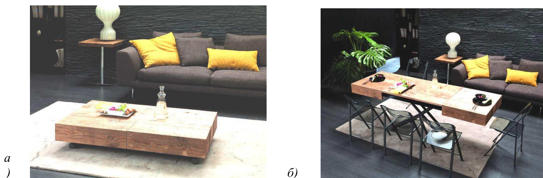
Рисунок 8. Журнальный столик, трансформирующийся в обеденный стол: а) журнальный стол; б) обеденный стол [4]

Трансформирующиеся столы часто применяются в дизайне интерьеров не только малогабаритных квартир, но и в интерьерах помещений средней площади. Конструкция трансформирующихся столов простая, что означает простоту эксплуатации предмета, а это, в свою очередь, повышает спрос на них среди потребителей [7, с.28]. Основными элементами в конструкции такого стола выступают ножки и столешница, дополнительные элементы (сегменты и ящики) зависят от разновидности комплектации выбранной модели. Раскладной стол в собранном состоянии занимает минимум площади и не зависит от стен. Самыми востребованными моделями являются столы, которые способны не только принимать несколько размеров, но и могут регулироваться по высоте. Такие модели, часто используются в гостиных в качестве журнальных столиков, а при необходимости трансформируются в большой обеденный стол (рис. 8) [8, с.64].