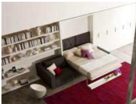
Рисунок 5. Встроенная стенка, являющаяся одновременно шкафом и зоной отдыха [3]

Современный рынок предметного дизайна развивается очень интенсивно, что влечет за собой быстрые темпы роста предложений вариантов элементов наполнения интерьеров. Одной из новинок предметного дизайна стали «комплексные трансформеры» – это полноценные мебельные гарнитуры, которые по габаритам в сложенном состоянии немногим превышают размеры дорожного чемодана (рис. 5). В одном корпусе могут быть совмещены: вместительный шкаф, рабочий стол, кресло и кровать. Подобная разновидность трансформирующейся мебели имеет высокий спрос среди дизайнеров и архитекторов для организации интерьеров в малогабаритных квартирах[5].