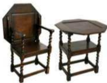
Рисунок 3. Стол, трансформирующийся в кресло американского производства[2]

Несмотря на свою оригинальность и удобство трансформирующаяся мебель не носила массового характера в особняках и замках аристократов. Рост популярности данной мебели начался с началом века индустриализации и с перемещением населения в города[3, с.54].